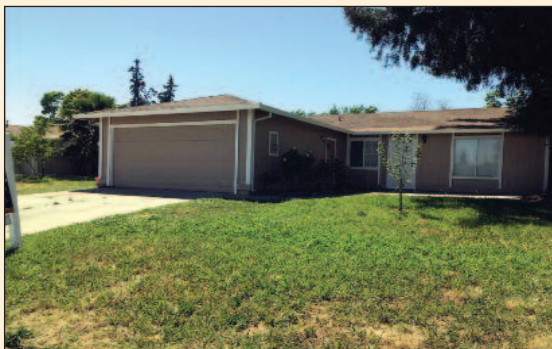
3 bdrm, 1.0 full bath 1,000 sq ft Lot size: 5,998 Year built: 1984 Listing Price: $259,000