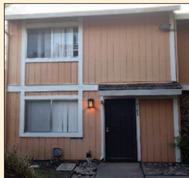
2 bdrm, 2.0 full bath 1,116 sq ft Lot size: 436 Year built 1984 Current Rent: $1450.00 Listing Price: $149,000

ਕੀ ਤੁਸੀਂ ਸੈਕਰਾਮੈਂਟੋ / ਬੇ-ਏਰੀਆ ਵਿਚ ਘਰ ਜਾਂ ਵਪਾਰਕ ਸੰਪਤੀ ਖਰੀਦਣ ਜਾਂ ਵੇਚਣ ਦੇ ਚਾਹਵਾਨ ਹੋ ਤਾਂ ਅੱਜ ਹੀ ਕਾਲ ਕਰੋ 916-271-5404