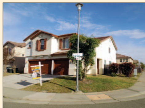
5 bdrm, 2.5 full bath 2,504 sq ft Lot size: 6,574 Year built: 2003 Listing Price: $419,000