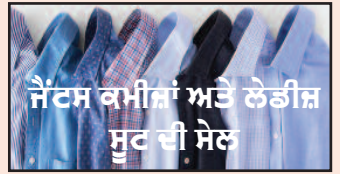
ਜੈਂਟਸ ਕਮੀਜ਼ਾਂ ਅਤੇ ਲੇਡੀਜ਼ ਸੂਟ ਦੀ ਸੇਲ

Toilet Water Pressure (Elite 2 Bio Bider) A budget Friendly solution for your desire to feel exceptionally clean and reduce toilet paper waste Only $ 41.99+Tax