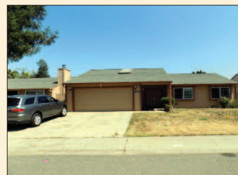
3-4 bdrm, 2.0 full bath 1,492 sq ft Lot size: 6,469 Year built: 1984 Listing Price: $319,000