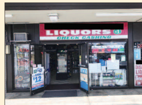
Beer & Wine Store for Sale in Santa Clara Monthly Gross: $90K Month Listing Price $699,000