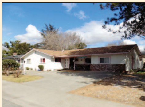
5 bdrm, 3.0 full bath 2,074 sq ft Lot size: 9,488 Year built: 1974 Listing Price: $280,000