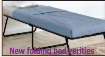
New folding bed varieties

Loose Fabrics, Groceries, Blankets, Vegetables