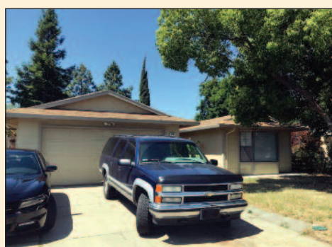
4 bdrm, 2.0 full bath 1,596 sq ft Lot size: 6,098 Year built: 1973 Listing Price: $309,000